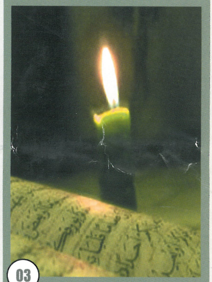
رحلة العطاء والبناء